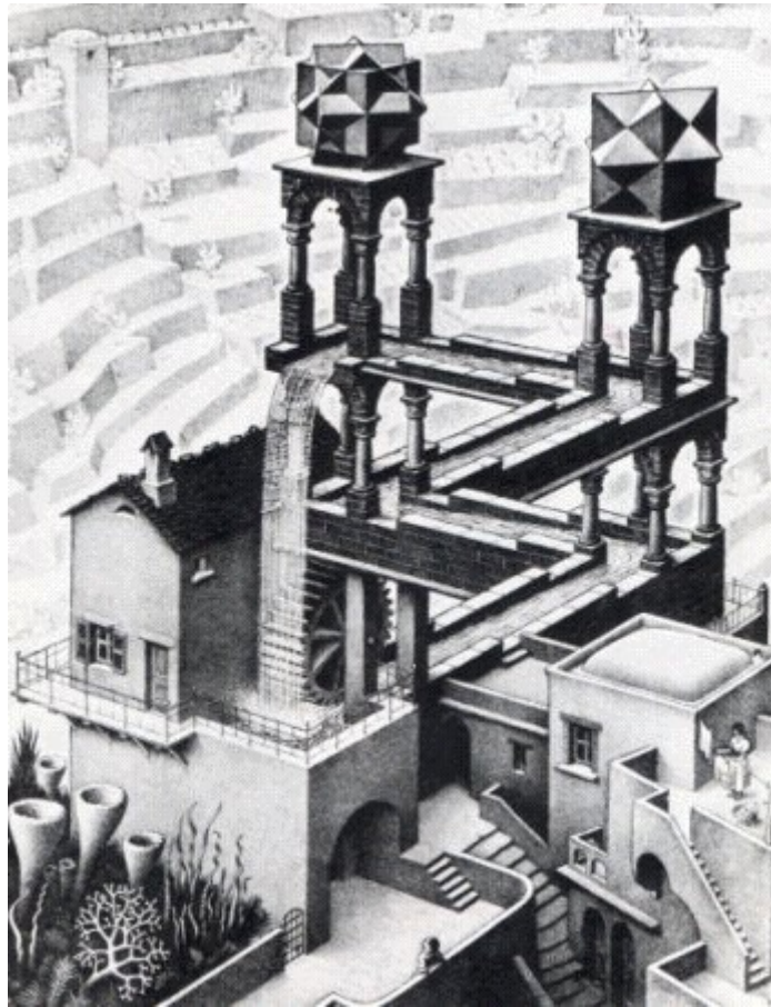
Illustration : Maurits Cornelis Escher Waterfall October 1961 lithograph